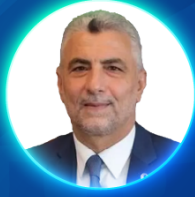
Prof. Dr. Ömer BOLAT

Komorlar Birliği Devlet Başkanı ve Afrika Birliği Dönem Başkanı